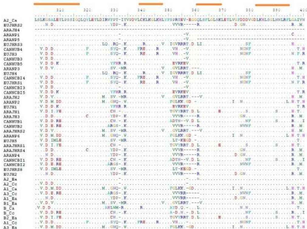
Figura 2. Fragmento do domínio LRR em CC-NBS-LRR de cafeeiro. EU = C. eugenoides , ARA = C. arabica , CAN = C. canephora . A1-A3, B e Cc = seqüências publicadas por Ribas et al. (2011), para C. arabica cv. IPR59 e C. canephora Cc. Motivos LRR estão indicados sobre o alinhamento com traços em cor laranja. ANANP5, ARAJH4 e B2-Ea e A2-Ea podem ser pseudogenes.