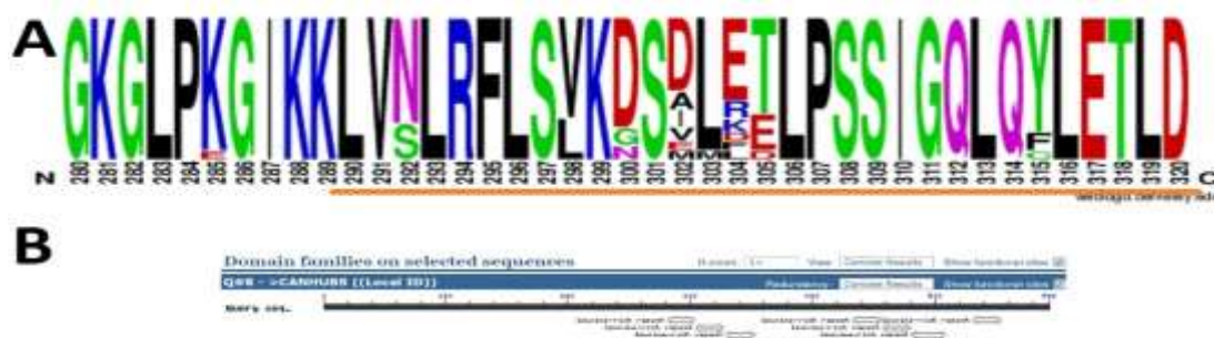
Figura 3. Seqüência e organização de motivos LRR em CC-NBS-LRR reunidos no “cluster” homólogo do S_H3 . A – A altura das letras que indicam os diferentes aminoácidos na seqüência correspondem à frequência deles em cada posição do alinhamento das 44 seqüências analisadas (vide Fig. 2). L é o código de uma letra para a leucina. B – organização das repetições LRR no peptídeo deduzido para as seqüências CANHUB5/CANNCB15 codificado no cromossomo 3 de C. canephora .

O agrupamento das seqüências (Fig. 4), excluídos ANANP5 e ARAJH4 que parecem ser pseudogenes com codons de terminação muito precoces, resultou na composição de seis ou sete clados principais. Nos clados mais amplos, como o 3 e o 6, peptídeos de C. arabica e C. canephora estão reunidos. Os clados 2 e 5 são restritos a seqüências codificadas nos genomas de C. eugenoides e C. canephora . E clados espécie-exclusivos foram formados por peptídeos de C. eugenoides (clado 4) e de C. arabica , com contribuição de CaOE e de IAPAR59 (clado 7).