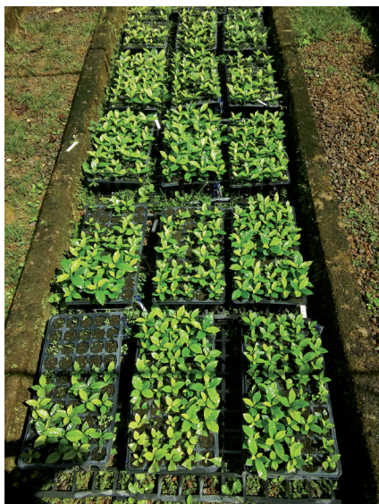
Figura 3. Microestacas de cafeeiro, produzidas com brotações induzidas sobre vitroplantas, aos seis meses depois da coleta, enraizadas e produzindo nós do ramo ortotrópico, em viveiro telado, com sombreamento de 50%.