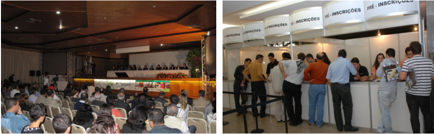
Auditório durante a apresentação de palestra Guichês para inscrição dos participantes

O grande interesse despertado pelo evento, que atraiu um significativo número de participantes, evidencia o fortalecimento desse arranjo institucional que é o Consórcio Pesquisa Café e o grande interesse nos temas abordados, num momento em que o governo, a sociedade e os órgãos de fomento se voltam para a questão cafeeira e, particularmente, para as estratégias de promoção e qualificação do produto nacional.