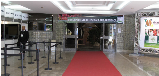
Entrada do evento no Centro de Convenções de Vitória