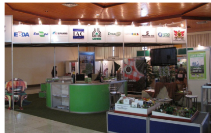
Estande do Consórcio Pesquisa Café levou tecnologias das consorciadas ao evento