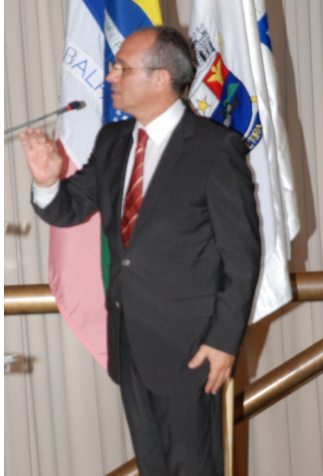
Paulo Hartung Governador do Espírito Santo