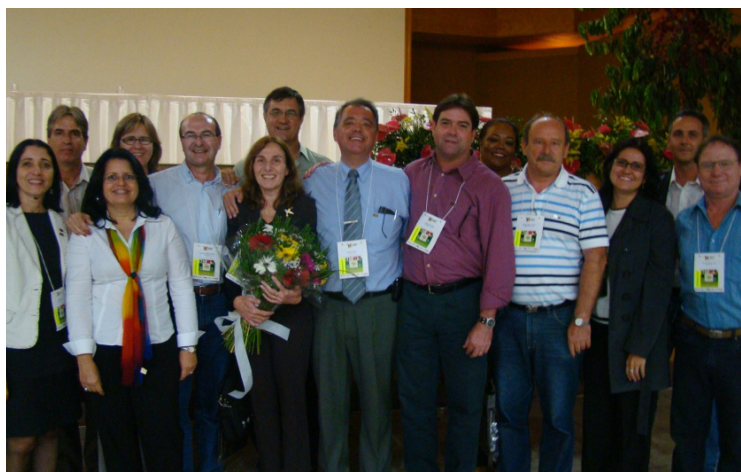
Comissões do Evento