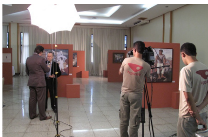
A TV Globo deu ênfase ao evento em sua programação