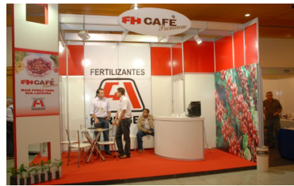
Estande da FH Café Premium