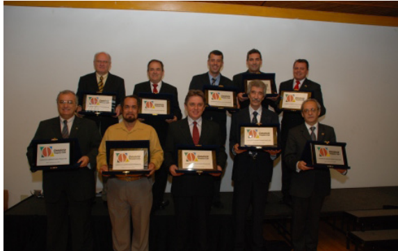
Representantes de instituições do consórcio com placa alusiva ao lançamento da logomarca