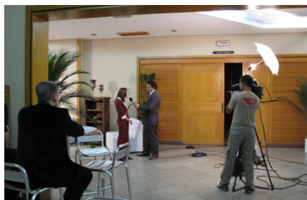
Gravação do programa Bom dia Espírito Santo da Globo

Durante a semana de realização do VI Simpósio, em Vitória, foram acompanhadas pela jornalista da Embrapa Café 12 (doze) entrevistas de dirigentes e pesquisadores do Consórcio para veículos de comunicação. Quinze (15) matérias foram veiculadas nos principais jornais do estado e 9 (nove) na TV. Foram veiculadas, ainda, na internet, 59 (cinquenta e nove) matérias jornalísticas tendo o evento como tema.