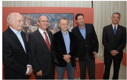
Autoridades durante visita à exposição Portinari