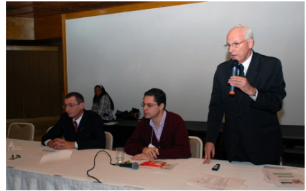
Luís Carlos Guedes Pinto, Vice-Presidente de agronegócios do Banco do Brasil

Luís Carlos Guedes Pinto, Vice-Presidente de Agronegócios do Banco do Brasil, abordou, em sua palestra, os fatores determinantes na dinâmica de integração entre agências de fomento e a pesquisa cafeeira. Ele apresentou um panorama da agricultura brasileira, mostrando os avanços do setor nos últimos anos, além de uma série de características que tornam o financiamento rural mais arriscado do que os outros tipos de financiamentos. Outra contribuição de Guedes foi traçar duas medidas para redesenhar a engenharia do crédito rural no Brasil: a ampliação do seguro rural e a proteção para o mercado futuro, medidas que protegem a produção e garantem a renda do produtor caso haja problemas nas lavouras. Guedes Pinto finalizou sua explanação dizendo que o grande desafio para a cafeicultura no Brasil é desenvolver uma ação conjunta a fim de articular uma política para a agricultura brasileira.