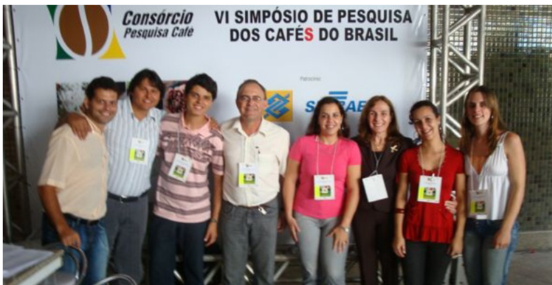
Bolsistas do Consórcio Pesquisa Café participaram da organização do evento

É importante ressaltar que o número de participantes do evento foi de aproximadamente 700 pessoas, fato que gerou a necessidade de maior número de pessoas envolvidas com o apoio no momento do evento, tendo sido aproveitada a contribuição de bolsistas do Consórcio para isso.