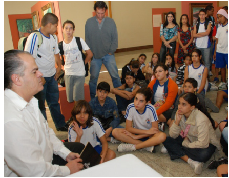
Estudantes de Vitória receberam informações sobre o “artista do café”