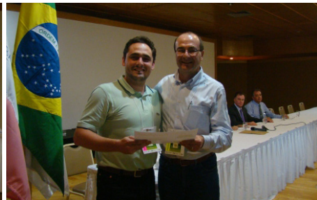
Entrega de homenagem ao trabalho destaque