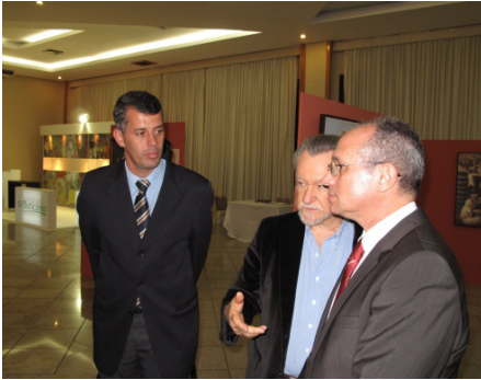
O Boticário tornou possível a exposição Portinari