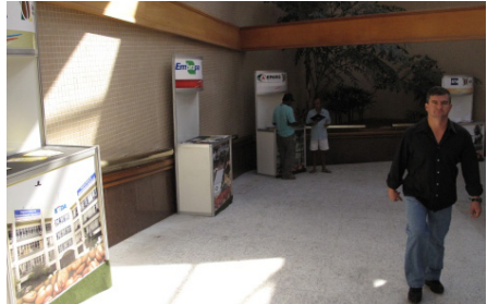
Quiosques das consorciadas foram montados na entrada do evento