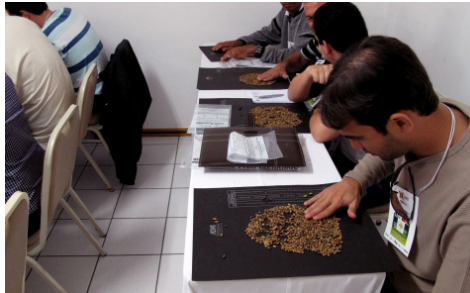
Mini-curso sobre classificação do café conilon

As opiniões expressas pelo conjunto de participantes dos mini-cursos consideraram que, de modo geral, os mesmos foram plenamente adequados, bem estruturados, com conteúdos pertinentes e encadeados e bem trabalhados pelos instrutores convidados, levando a uma visão abrangente das temáticas abordadas e a possibilidade de situar essas questões no contexto atual da cafeicultura. Além disso, o nível dos instrutores foi considerado um ponto forte. O tipo de abordagem foi avaliado como indicativa de que o direcionamento de discussões de temas mais pertinentes no formato de mini-cursos seria um formato adequado e que deveria ser mantido para os próximos eventos.