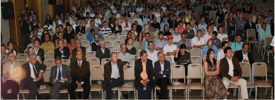
Abertura do evento no salão do Centro de Convenções de Vitória

programação técnica do evento, pequenos cursos de caráter presencial e com carga horária de 4 horas, desenvolvidos com atividades que propiciaram tanto a aquisição e atualização de conhecimentos como a reflexão e o tratamento dos temas de importância, regional e nacional, para o setor produtivo do agronegócio café.