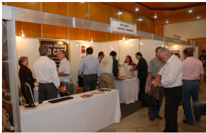
Estande do SBI Café e da Coffee Science