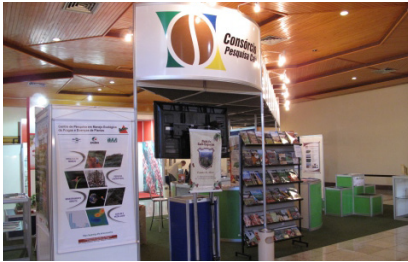
Estande do Consórcio Pesquisa Café