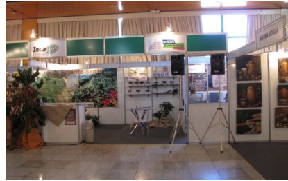
Estande do Incaper na exposição