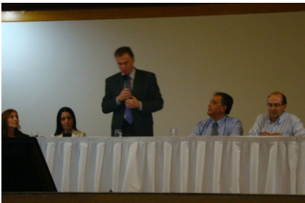
Casagrande discursando no encerramento do evento

O encerramento do evento contou com a presença do senador da república, Renato Casagrande, além de outras autoridades. O senador discursou sobre a importância da realização do Simpósio no Estado do Espírito Santo. Durante o encerramento, foram premiados os trabalhos que mais se destacaram no evento.