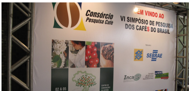
Apresentação dos patrocinadores no salão de entrada do evento