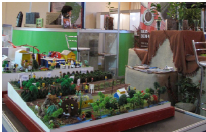
O sistema Treino e visita no estande do Consórcio