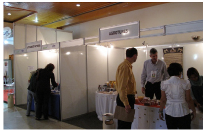
Estande da Agrotures