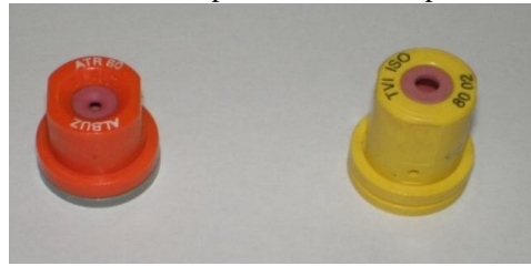
Figura 1. Pontas de jato cônico vazio sem indução de ar (esquerda) e jato cônico vazio com indução de ar (direita) utilizadas nas pulverizações.

As aplicações com as pontas jato cônico vazio com e sem indução de ar resultaram em deriva máxima de 5,06% e 6,68%, respectivamente, no ponto de coleta mais próximo da área aplicada.