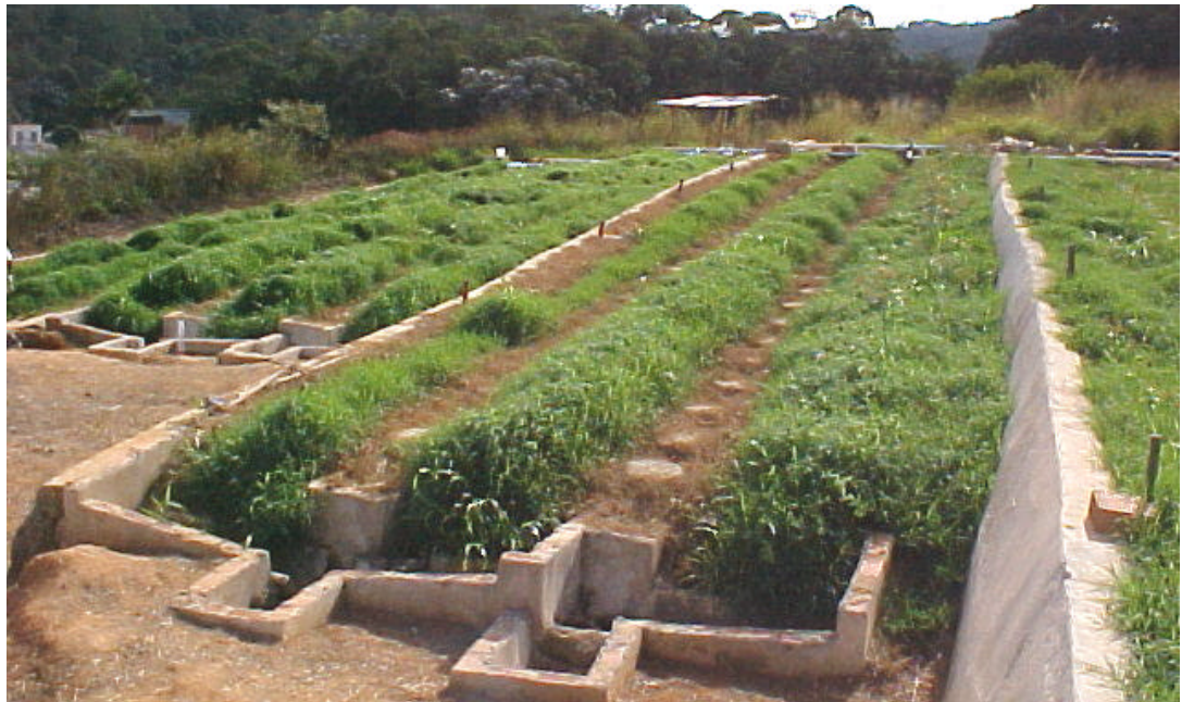
Figura 3 - Vista geral das rampas para tratamento por escoamento superficial.