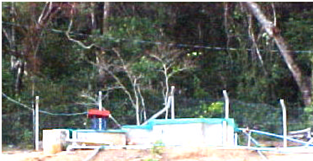
Figura 2 - Vista geral da estrutura para tratamento preliminar.

- Tratamento Terciário: constituído por lagoa de maturação de 300 m 3 , de capacidade com 50 m de comprimento, 6 m de largura e 1 m de profundidade (Figura 4), a qual teve como objetivo primordial a remoção de patógenos.