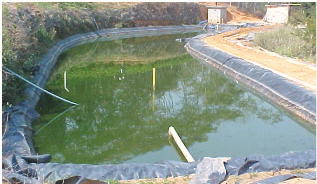
Figura 4 - Lagoa de maturação.