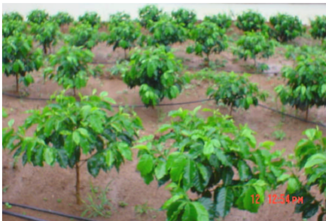
Figura 5 - Café fertirrigado por gotejamento

1 - pH em água - Relação 1:2,5; 2 - P e K = fósforo disponível e potássio trocável, respectivamente, extraídos com Mehlich 1 e determinados conforme o método definido por DEFELIPO e RIBEIRO (1981); 3 - Ca, Mg, e Al = cálcio, magnésio e alumínio trocáveis, respectivamente, extraídos com KCl 1 mol L -1 e determinados conforme DEFELIPO e RIBEIRO (1981); e 4 - Determinado pelo método Walkley-Black (DEFELIPO e RIBEIRO, 1981).